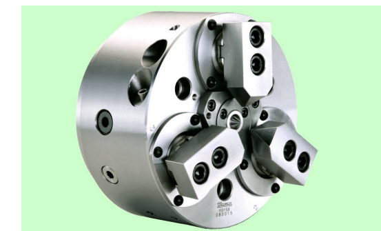
把握爪は付属しておりません。Top jaws are not attached to this chuck.