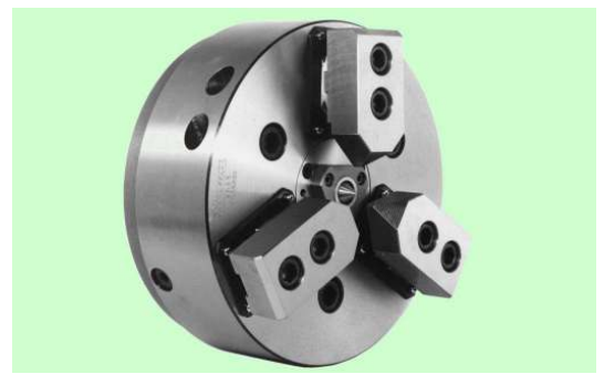
把握爪は付属しておりません。Top jaws are not attached to this chuck.